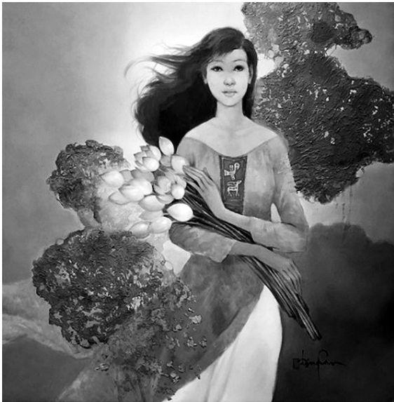
Hình 7. Hương sen (2016). Đặng Can. Sơn dầu

Ông vẽ sơn dầu với bút pháp giống như tranh lụa, tán màu thật mịn, đường nét mềm mại, mang đậm nét trữ tình. Ngoài đề tài tranh phong cảnh, sinh hoạt về vùng đất Tây Nam bộ, mảng đề tài không kém phần đặc sắc của ông là phụ nữ trong tà áo dài, với lối vẽ nhẹ nhàng, uyên chuyên, những cô gái trong tranh của ông như những nàng thơ mong manh, thướt tha, với vẻ trong sáng, dịu dàng, e ấp mang đậm nét quê hương.