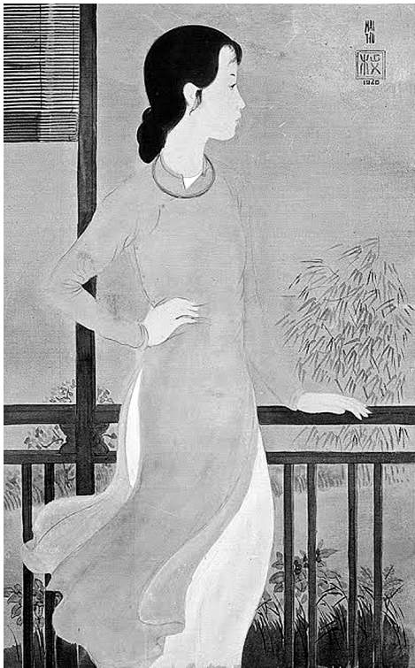
Hình 4. Người phụ nữ nhìn qua ban công (1940). Mai Trung Thứ. Lụa