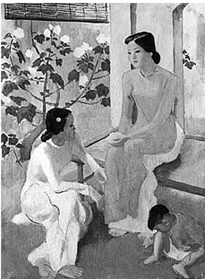
Hình 2. Hai thiếu nữ và em bé (1944). Tô Ngọc Vân. Sơn dầu

Tác phẩm Hai thiếu nữ và em bé cũng được họa sĩ Tô Ngọc Vân thể hiện rất thành công về đẹp của người phụ nữ trong chiếc áo dài. Tranh diễn tả ba nhân vật với ba độ tuổi khác nhau, dáng ngồi khác nhau diễn hình với từng độ tuổi, nét ngây thơ hồn nhiên của em bé, vẻ e ấp của cô thiếu nữ trong tà áo dài trắng và sự đầy đặn, mặn mà, đầm thắm của người thiếu phụ với dáng ngồi vững chãi. Tất cả những yếu tố ngôn ngữ tạo hình đã tôn lên vẻ đẹp của người phụ nữ Việt Nam trong trang phục áo dài dân tộc. Hình ảnh hai cô gái và em bé bên cây hoa phù dung đang độ đẹp rực rỡ và tinh khiết nhất đã gọi cho người xem một liên tưởng về vẻ đẹp của người phụ nữ Việt đậm chất Á đông.