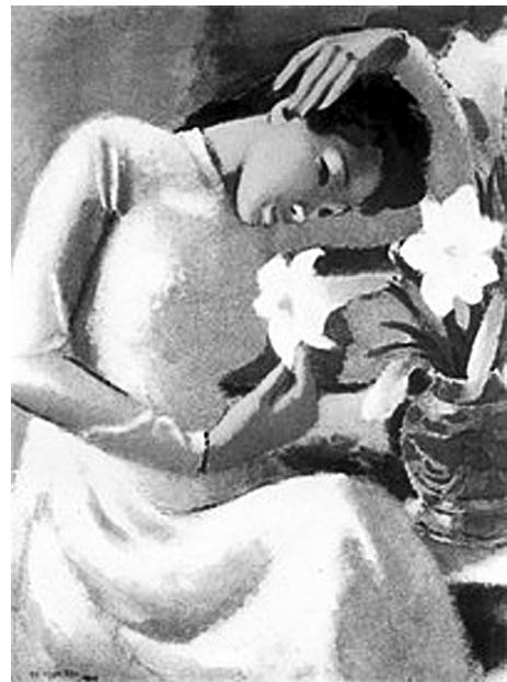
Hình 1. Thiếu nữ bên hoa huệ (1943). Tô Ngọc Vân. Sơn dầu.

Hình tượng trong tranh là một thiếu nữ tân thời duyên dáng, tươi trẻ bên hoa huệ trắng (còn gọi là Huệ tây hay Bách hợp), loại hoa là biểu tượng cho sự thuần khiết, trinh nguyên. Bức tranh không chú trọng tả chân dung nhân vật cụ thể, mà chỉ gợi về sự thanh cao, bình lặng, có nét đài các của thiếu nữ Hà Thành.