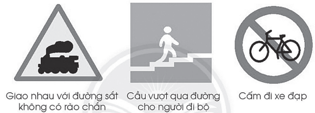
Hình 1. Thực hành và trải nghiệm: “Em đi bộ theo luật giao thông” sách giáo khoa Toán 1 - Chân trời sáng tạo

Với tình huống trên, giáo viên có thể gắn với trò chơi: “Ai nhanh hơn”