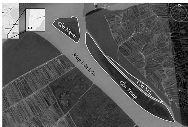
Hình 1. Khu vực nghiên cứu

Phạm vi nghiên cứu là các cồn cát nằm ở cửa Ông Trang, phía Tây sông Cửa Lớn thuộc địa phận huyện Ngọc Hiển, tỉnh Cà Mau. Các cồn bao gồm Cồn Trong, Cồn Ngoài và Cồn Mới được gọi chung là Cồn Ông Trang. Trong đó, Cồn Trong hình thành sớm nhất, diện tích Cồn Trong năm 1962 là 16,34 ha. Cồn Ngoài xuất hiện vào khoảng những năm 1980, đến năm 1992 có diện tích là 55,79 ha. Cồn Mới mới bắt đầu hình thành vào khoảng những năm 2000 (Lu, 2020).