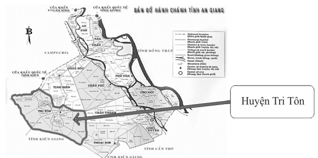
Hình 1. Bản đồ hành chính tỉnh An Giang và vùng nghiên cứu

Nghiên cứu được thực hiện tại 02 (hai) xã tiêu biểu vùng đồi núi của huyện Tri Tôn: (1) xã Cô Tô; (2) xã Núi Tô. Nghiên cứu đã sử dụng hai nguồn số liệu cơ bản: (1) số liệu thứ cấp được thu thập từ các báo cáo về tình hình kinh tế xã hội cấp tỉnh, huyện, các báo cáo khoa học có liên quan bao gồm: niên giám thống kê An Giang và báo cáo tổng kết của tình hình sản xuất nông nghiệp trên địa bàn Tỉnh và huyện; (2) số liệu sơ cấp được thu thập thông qua tham vấn lãnh đạo cấp huyện, phỏng vấn sâu nông dân và phỏng vấn 30 nông hộ trồng lúa và sản xuất rau màu tại 2 xã nghiên cứu với các nội dung chính như sau: lịch sử khai thác và sử dụng đất của nông hộ, kỹ thuật canh tác các mô hình và quản lý đất, các yếu tố hạn chế đến năng suất và sức sản xuất của đất ảnh hưởng đến hiệu quả sản xuất của nông hộ, và thu thập các thông tin liên quan đến kinh tế và xã hội khác. Nội dung phân tích chủ yếu của nghiên cứu này tập trung tìm hiểu hiện trạng các mô hình sản xuất nông nghiệp trên đất gò hiện nay thích ứng với điều kiện khan hiếm nước vào mùa khô, mưa trái vụ không theo qui luật tự nhiên như trước đây, đồng thời phân tích được các yếu tố chính ảnh hưởng đến quyết định trong việc chuyển đổi mô hình canh tác của nông hộ và cuối cùng là đề xuất các mô hình nông nghiệp tiềm năng thích ứng với điều kiện BĐKH và phù hợp với điều kiện sản xuất, tập quán canh tác của người dân vùng nghiên cứu.