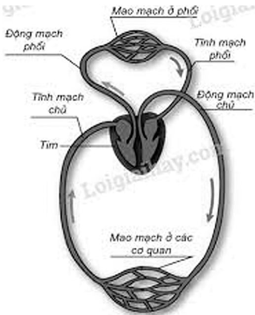
Hình 2. Sơ đồ vòng tuần hoàn lớn và vòng tuần hoàn nhỏ

Nhóm HS quan sát sơ đồ: sử dụng giác quan mắt ghi nhận các thông tin trên đối tượng: màu đỏ, sẫm; ký hiệu đường mạch máu, mô hình tim; mũi tên; tên các bộ phận cơ quan tuần hoàn, từ đó hoàn thành phiếu học tập: