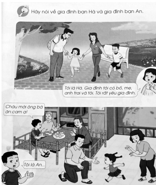
Hình 1. Gia đình bạn Hà và gia đình bạn An

- Tiếp theo GV chỉ vào hình gia đình bạn An: đây là gia đình bạn An, bạn An giới thiệu: “Tôi là An...” và nói “Cháu mời ông bà ăn cam ạ!”. GV vậy các em hãy chỉ và nói với nhau: (1) Gia đình bạn An có những ai? (ông, bà, An, bố An, mẹ An, em gái An); (2) Gia đình bạn An đang làm gì? (đang ở nhà, vui chơi: ông, bà, An ngồi ở bàn ăn cam, uống nước, bố, mẹ, đang xem em gái An chạy chơi); (3) Nhìn vào gia đình bạn An em thấy các thành viên có thương yêu nhau không? (ông, bà vui cười, An mời ông, bà ăn cam, ông đang choàng tay lên An thể hiện thương yêu An; bố, mẹ An cùng vui đùa, chăm sóc em gái An). (Mai & cs., 2019) và (Mai & cs., 2020).