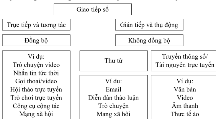
Hình 1. Các loại giao tiếp số trong giáo dục

Trong giáo dục, Manea (2020) phân biệt ba loại giao tiếp sử dụng đồng thời trong môi trường trường học và xã hội gồm giao tiếp giữa người với người, giao tiếp giáo dục và giao tiếp sư phạm. (1) Giao tiếp giữa người với người là một phương pháp tương tác tâm lý xã hội cơ bản giữa các cá nhân, diễn ra trong các hệ thống và ngôn ngữ phức tạp, (2) Giao tiếp giáo dục là nền tảng của mọi quá trình giáo dục, ở mọi cấp độ, bất kể nội dung và độ phức tạp, hình thức hay các bên tham gia vào quá trình đó (giao tiếp giữa giáo viên và phụ huynh trong các hoạt động ngoại khóa, cuộc họp, hội nghị,...) và (3) Giao tiếp sư phạm, một hình thức giao tiếp giáo dục đặc thù, gắn liền với các hoạt động và nỗ lực sư phạm nhằm mục đích học tập có hệ thống và được hỗ trợ. Giao tiếp giáo dục và giao tiếp mang tính sư phạm có thể được coi là những hình thức chuyên biệt của hiện tượng giao tiếp giữa các cá nhân, vốn vô cùng phức tạp và năng động. Trong bối cảnh giáo dục hiện nay, ba loại hình giao tiếp nêu trên cũng có thể được bổ sung thêm giao tiếp số, giao tiếp số đề cập đến sự tương tác diễn ra trong môi trường số và đòi hỏi việc chia sẻ thông điệp (có thể là biểu tượng cảm xúc, email, tin nhắn SMS, bài đăng,...) giữa người gửi và người nhận thông qua các thiết bị kỹ thuật số. Giao tiếp số theo Urbanek & cs. (2023) có 2 loại gồm (1) Trực tiếp và tương tác và (2) Gián tiếp và thụ động.